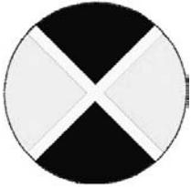
Entwurf von Jens Doll, siehe [18]