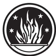
Flammenschale des BFGD (Bund Freireligiöser Gemeinden Deutschlands), zu [18]

Ich möchte aber sagen, das bei der Vorstellung unseres noch gültigen Zeichens mir niemand bisher gesagt hat,