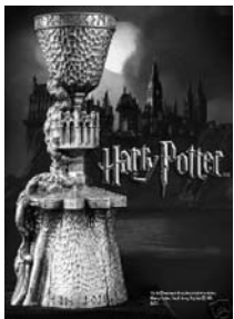
Feuerkelch bei Harry Potter (mit Runen)