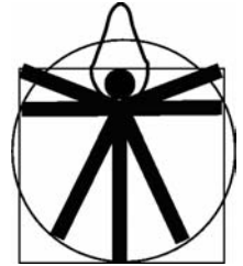
Entwurf von Michael Schlegel, siehe [33]

Alle Entwürfe stehen „live und in Farbe“ im Internet unter http://www.ramm.ch/u/?menu=0-2