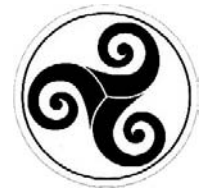
Triskel, häufige keltische (bretonische) Darstellung