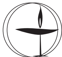
Flammenschale der Unitarian Universalists (1941–2005), zu [15]

allen religiösen Darstellungen) Symbol für den Heiligen Geist.